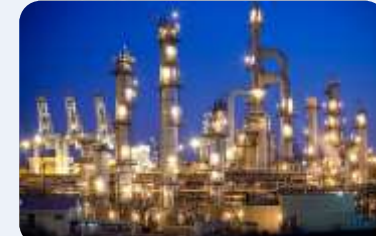
PANČEVO I RIJEKA DOVOLJNI