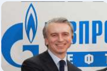
DJUKOV: MOŽE U EVRIMA