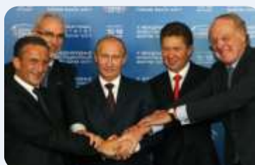
ODLAŽE SE, NE ODLAŽE ...