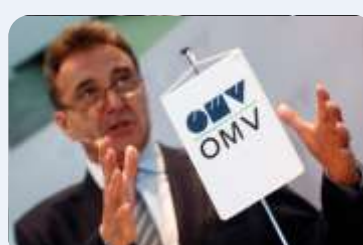
VEĆA RUDNA RENTA