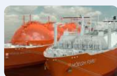
LNG REŠENJE ZA EU?