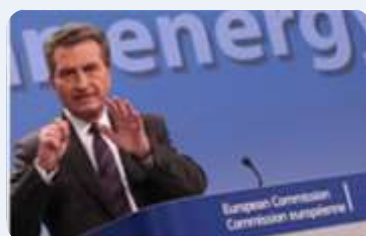
SAMO BEZ PANIKE!